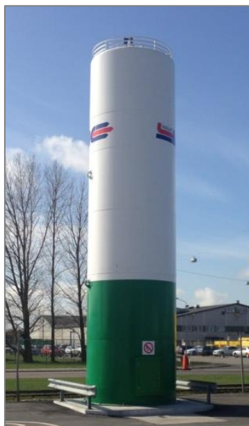
Vertikal tank på 60 m 3 diameter 2900 mm. Udført med rum under selve tanken inkl. adgangsdrør.