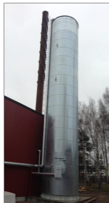
Vertikal tank på 100 m 3 diameter 2900 mm. Tanken er forsynet med 200 mm isolering og dækplade.