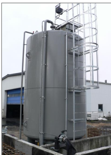
20 m 3 vertikal tank med en diameter på 2500 mm. Udført med stige og platform, nedført påfyldning, nedført sugerør, lækageovervågning m.m.