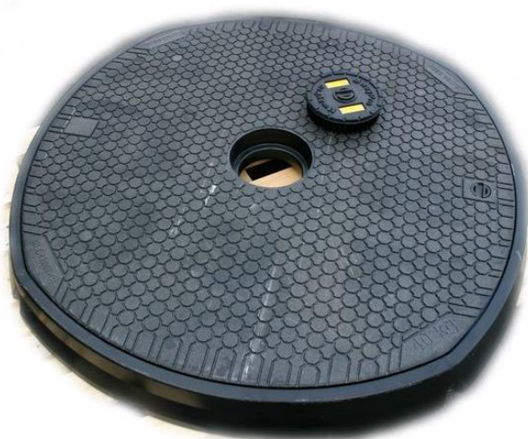
Modell SLC3600DC med pejllock för att komma åt pejlsticka.