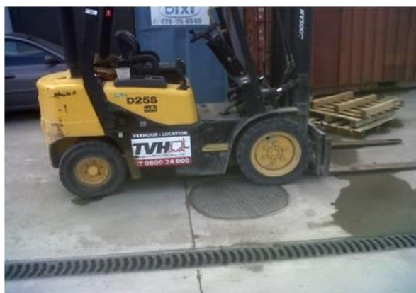
Model SLC3600 (Ø 900 mm)