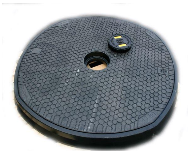
Model SLC3600DC med pejlelem til brug i forbindelse med eks. olietanke