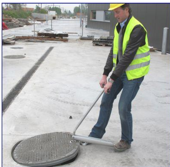
Kombineret hånd- og fodbetjent åbneværktøj