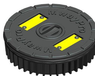
150 mm dæksel til pejlelem (model DC). Kan leveres med 9 forskellige farver af mærkeplader (SLT0010xx).