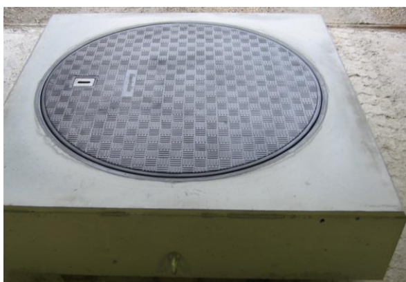
Kan også leveres indstøbt i beton