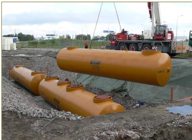
Installation af i alt 4 stk. 30 m 3 enkeltvæggede jordtanke.