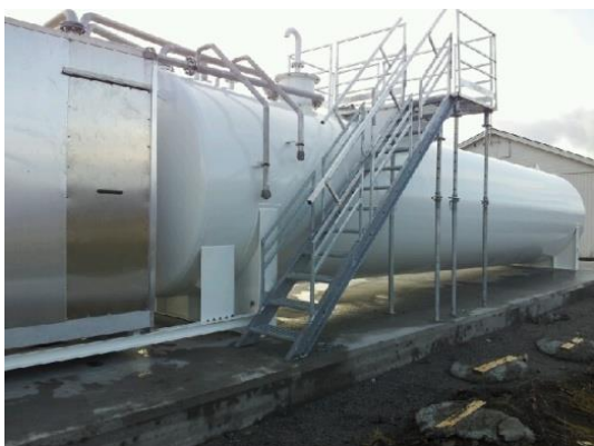
60 m 3 dobbeltvægget tank til flybrændstof

Tankene kan leveres med et bredt udvalg af tilbehør såsom stige, platform/rækværk, platform for stander, tag over stander, komplet rørføring, overfyldningsværn m.m.