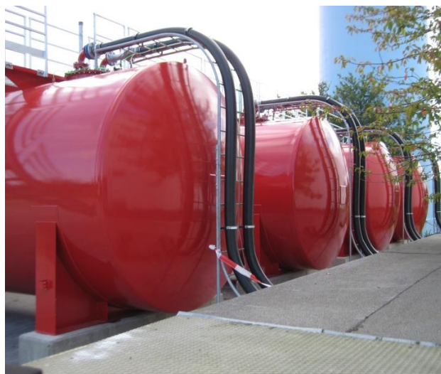
4 x 100 m 3 dobbeltvægede tanke med gangbro