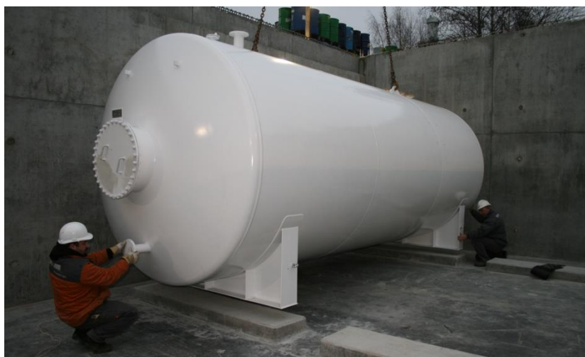
30 m 3 enkelmantlad cistern med diametern 2,5m