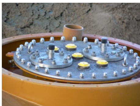
DN600 mandekarm med ramme for montage af nedstigningsskakte. Størrelsen af rammen tilpasses de forskellige modeller af skakte.