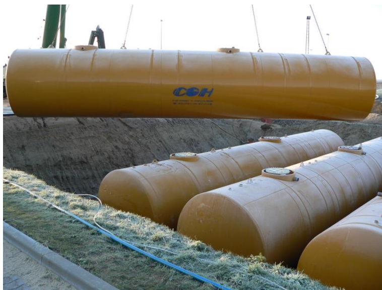
4 x 100 m 3 dobbeltvæggede jordtanke til transportcenter