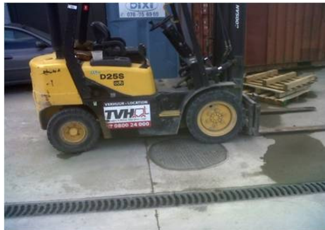
Model SLC3600 (Ø 900 mm)