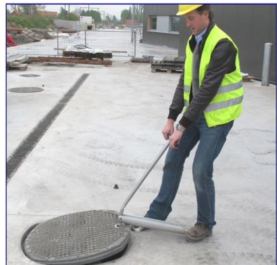
Kombineret hånd- og fodbetjent åbneværktøj