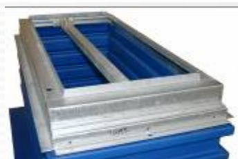
DFK4422 er her vist installeret på en US4822 sump. På billedet er også vist montagestangen, som frit kan justeres i hele bredderetningen.

Montagebeslag BA0004 . Leveres komplet med alle nødvendige dele.