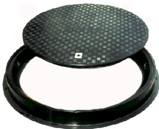
SL3600 til indstøbning på byggeplads

Hvis man selv ønsker at stå for indstøbning af delene i beton, kan dette også lade sig gøre. Dæksel, ramme og skørt leveres løst, og den medfølgende anvisning angiver hvordan indstøbningen skal udføres.