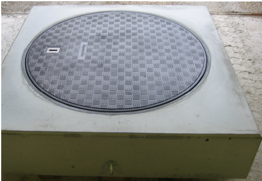
Model SL3600 indstøbt i beton – klar til installation på byggeplads.

Hvis man selv ønsker at stå for indstøbning af delene i beton, kan dette også lade sig gøre. Dæksel, ramme og skørt leveres løst, og den medfølgende anvisning angiver hvordan indstøbningen skal udføres.